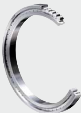
Cuscinetti a rulli cilindrici a pieno riempimento di NKE (senza gabbia)