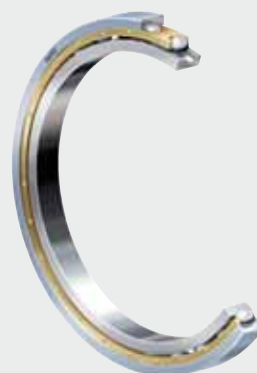
Cuscinetti radiali a sfere di NKE (con rivestimento elettrico isolato sull'anello esterno)