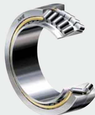
Cuscinetto a rulli conici di NKE