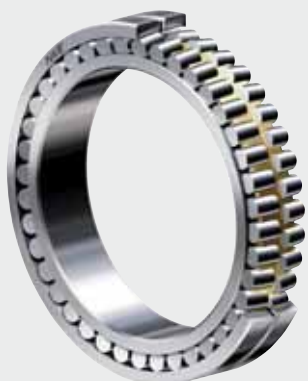
Cuscinetti orientabile a rulli di NKE