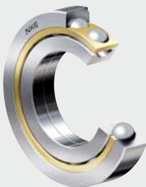
Cuscinetti a sfere a quattro punti di NKE