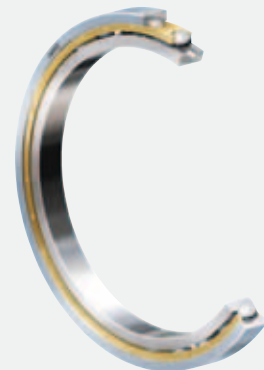
NKE Rillenkugellager (hier mit elektrisch isolierender Beschichtung am Außenring)