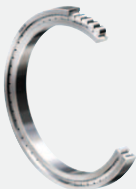
Roulements à rouleaux cylindriques jointifs de NKE (sans cage)