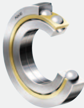
Roulements à billes à quatre points de contact de NKE