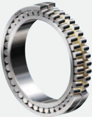
Roulements à rouleaux sphériques de NKE