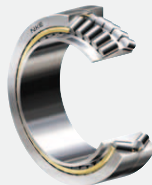
Roulements à rouleaux coniques de NKE