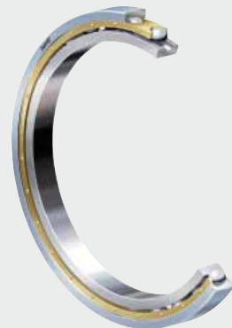
NKE Rillenkugellager (hier mit elektrisch isolierender Beschichtung am Außenring)