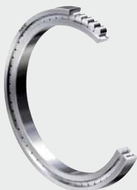
Vollrollige NKE Zylinderrollenlager (ohne Käfig)