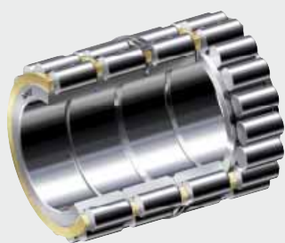
Mehrrühige NKE Zylinderrollenlager