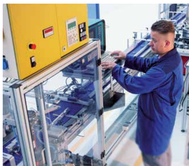
Die 100% Geräuschprüfung garantiert höchste Präzision