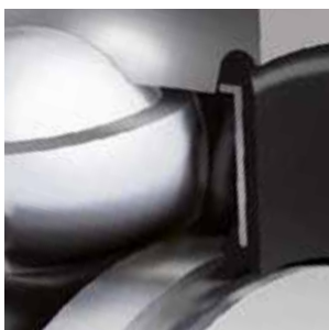
Die neu entwickelte NKE Doppellippen-Labyrinthdichtung