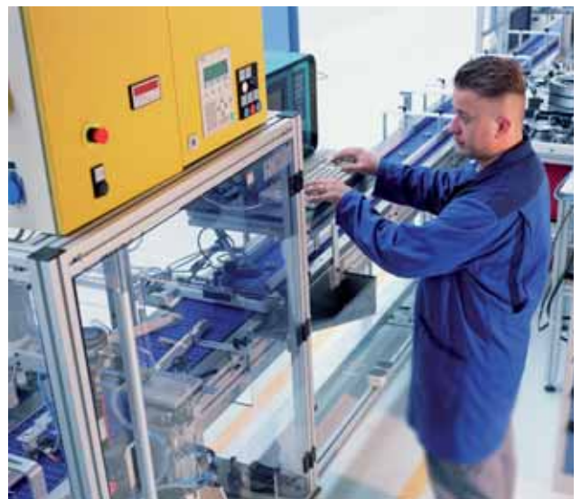
100% prueba de ruido garantiza máxima precisión.