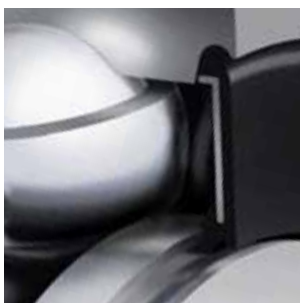
Die neu entwickelte NKE Doppellippen-Labyrinthdichtung