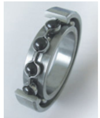
NKE Hybridlager mit Keramikwälzkörpern