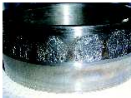
Roulement endommagé en raison d'un montage incorrect

Les roulements doivent être stockés correctement, conformément aux instructions du fabricant. Il faut s'assurer que le lubrifiant est maintenu exempt de toute contamination. L'état du lubrifiant doit être contrôlé avec soin avant chaque application. L'utilisation de lubrifiants anciens ou contaminés peut provoquer des défaillances prématurées des roulements.